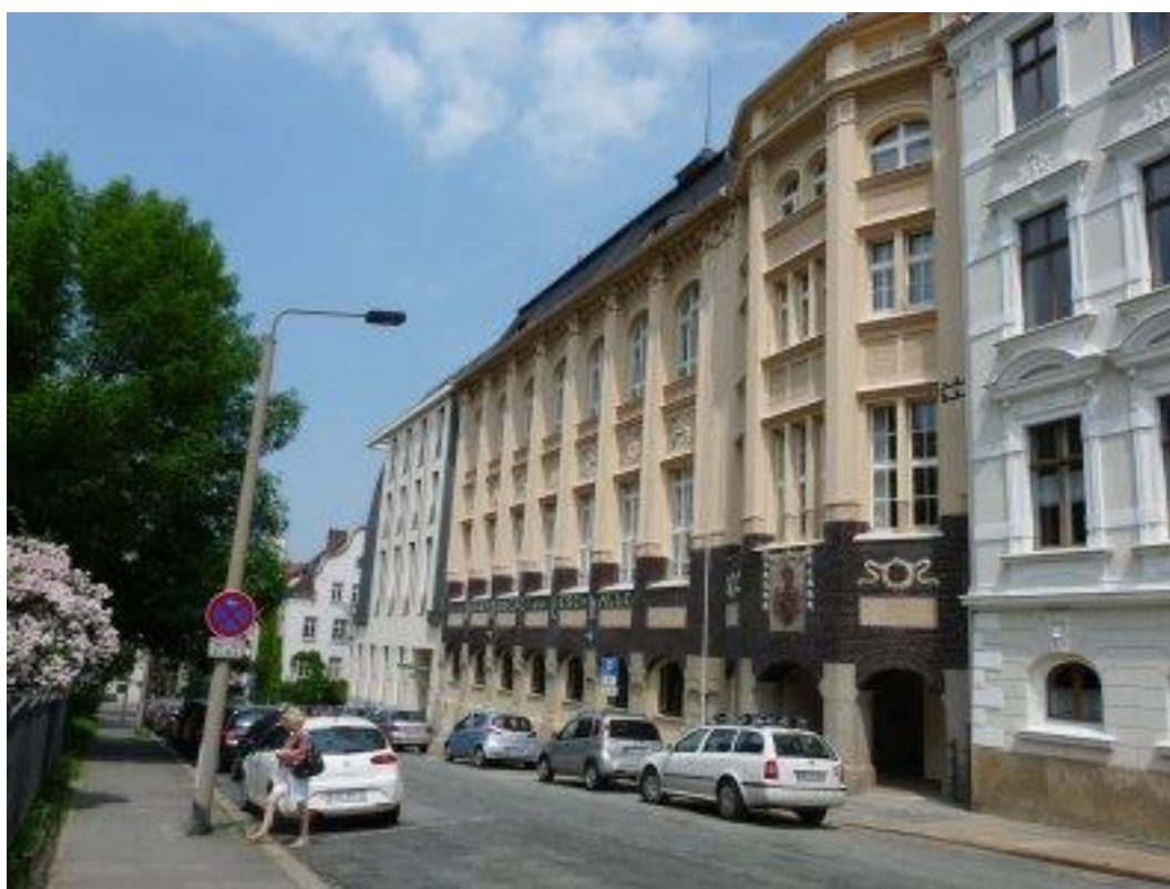
Rys. 1. Odnowiony gmach biblioteki z 1907 roku i młodsza o 100 lat nowa część biblioteki

Biblioteka jest czynna dla użytkowników 30 godzin tygodniowo. Zatrudnia 15 osób, w tym 11 na pełnym etacie, 6 bibliotekarzy dyplomowanych, 5 asystentów, 1 introligatora. Bibliotekarze korzystają z pomocy wolontariuszy. Liczba czytelników biblioteki wynosi 5000 osób, a liczba odwiedzin 100 000 rocznie.