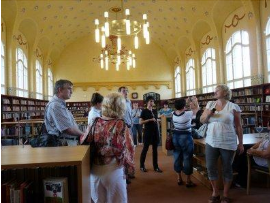
Rys. 2. Czytelnia