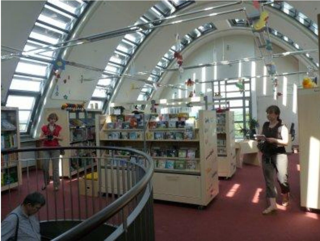
Rys. 4. Sala dla najmłodszych

Strona biblioteki: http://www.stadtbibliothek.goerlitz.de/