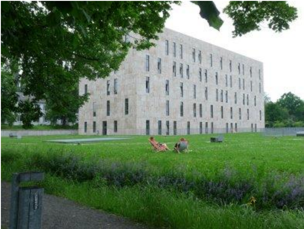
Fot. 1. Jeden z dwóch budynków kompleksu