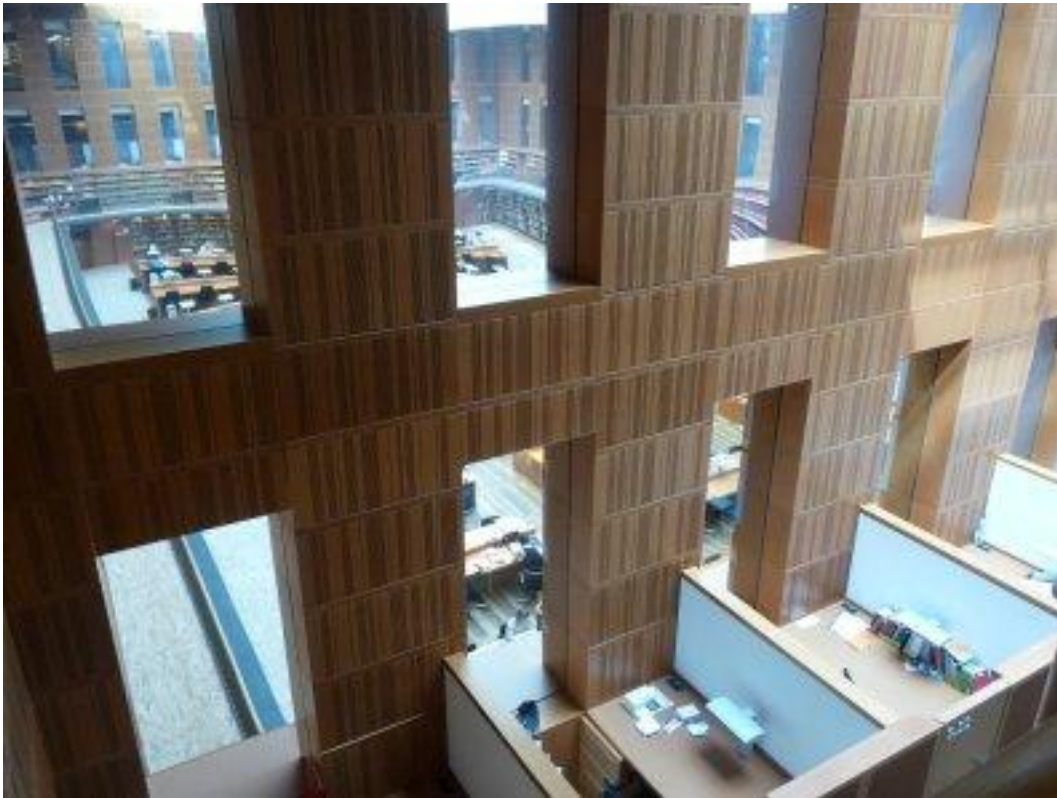
Fot. 3. Wydzielone do pracy indywidualnej boksy, w tle czytelnia