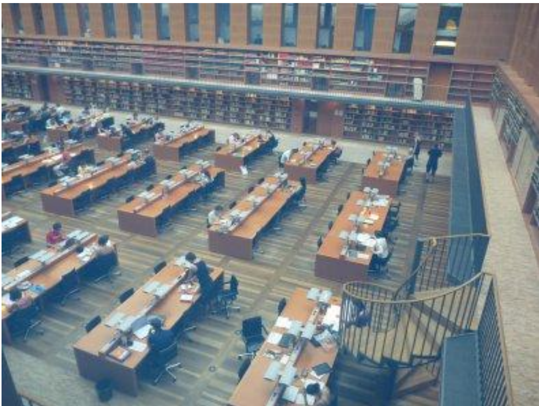
Fot. 4. W centralnej części kompleksu umieszczona jest czytelnia