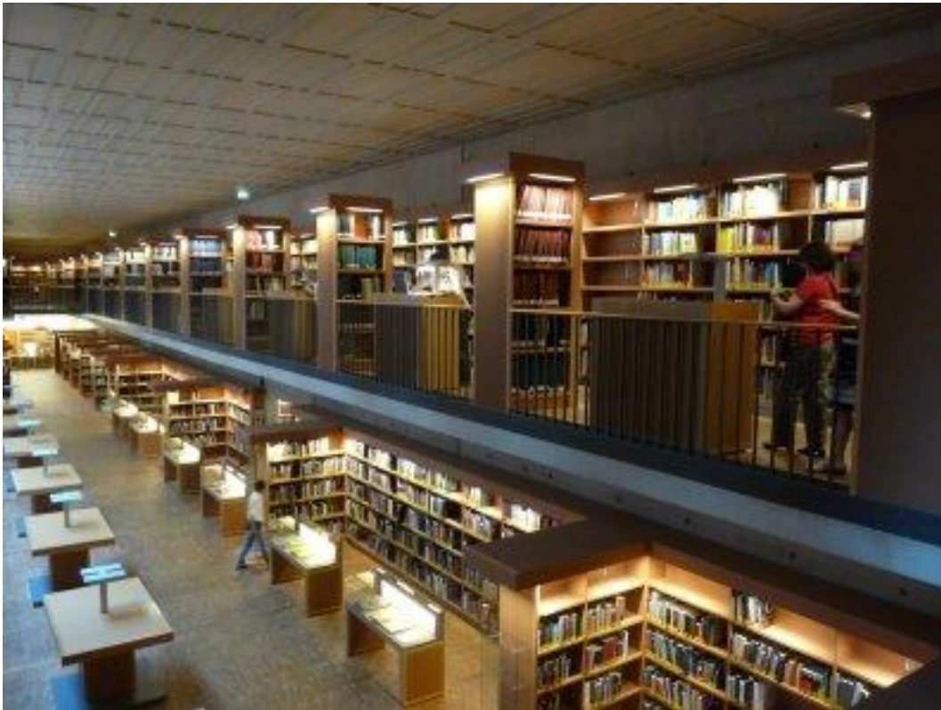
Fot. 5. Wolny dostęp do zbiorów