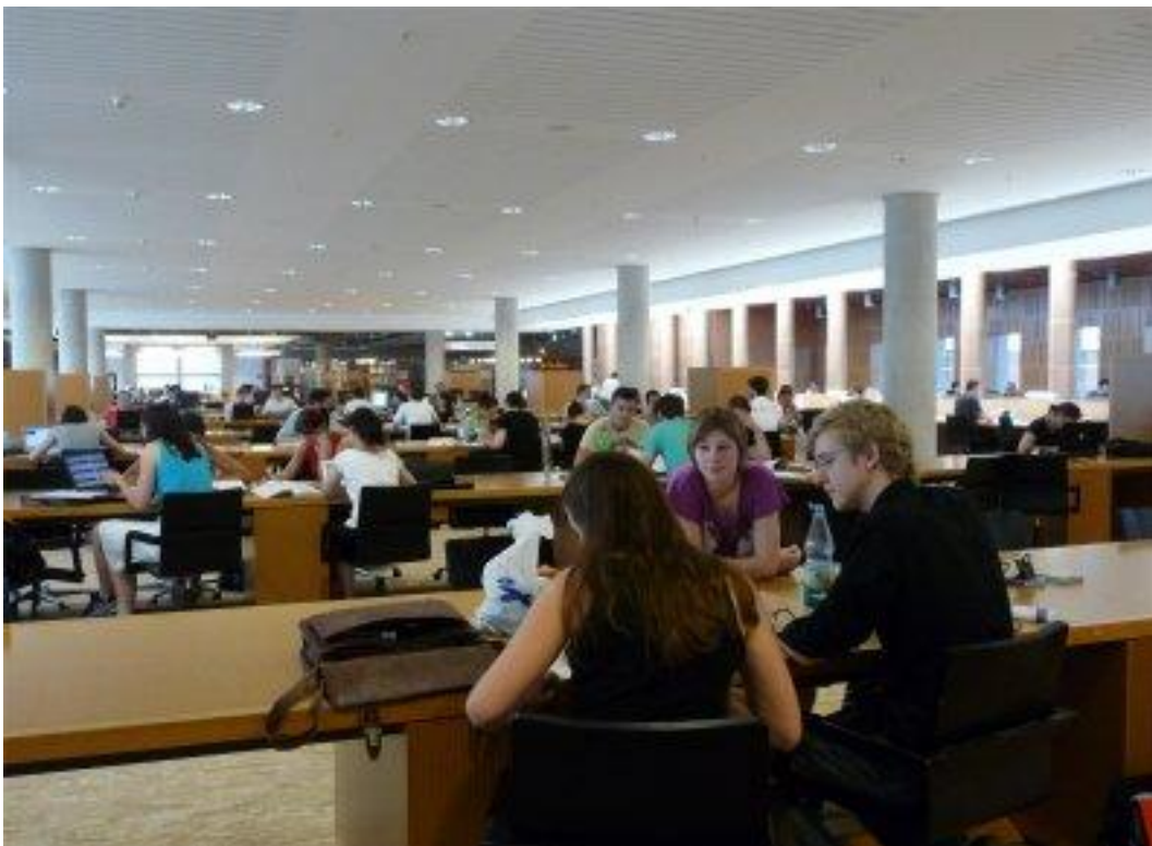
Fot. 2. Hol biblioteki