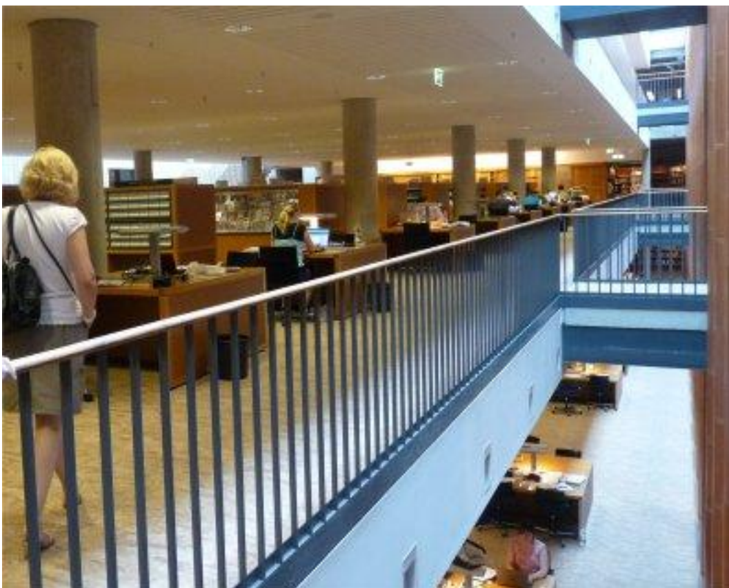
Fot. 6. Wszędzie rozmieszczone są stanowiska do pracy