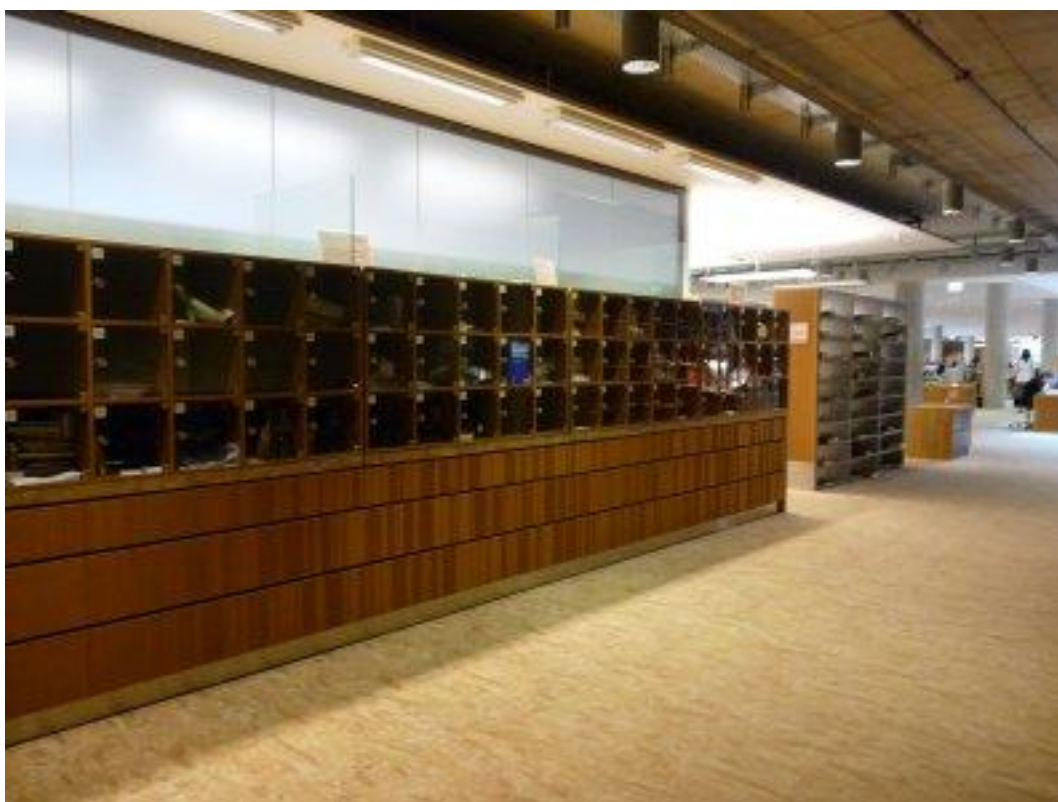
Fot. 8. Książki ze zbioru prezencyjnego można przechować do późniejszego wykorzystania